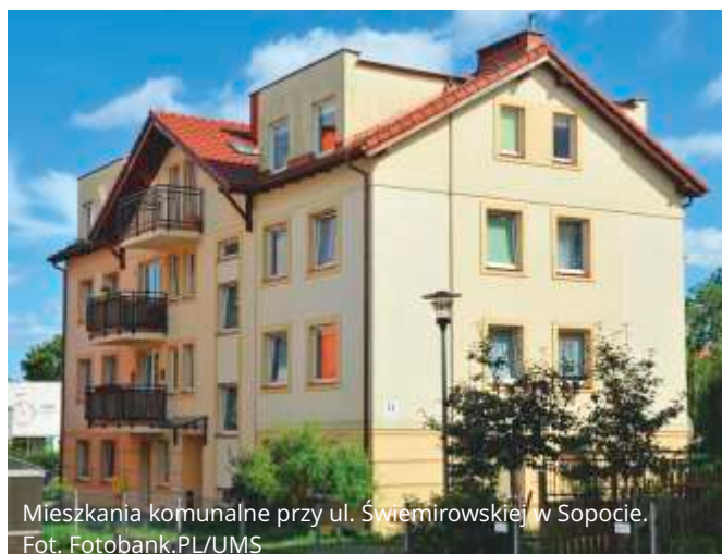
Mieszkania komunalne przy ul. Świeмиrowskiej w Sopocie.

W dodatkowym naborze, z uwzględnieniem wysokości dochodu za lata 2016-2017, przewidziano także możliwość ubiegania się o najem lokali 2-pokojowych przez gospodarstwa domowe minimum 2-osobowe oraz