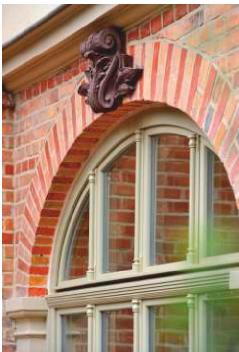
Termomodernizacja przedszkola „Pod Wieżyczką” została zrealizowana z troską o detale architektoniczne budynku.

Przedsięwzięcie to jest częścią projektu unijnego, dofinansowanego w wysokości 9,89 mln zł w ramach Regionalnego Programu Operacyjnego dla Województwa Pomorskiego w latach 2014-2020.