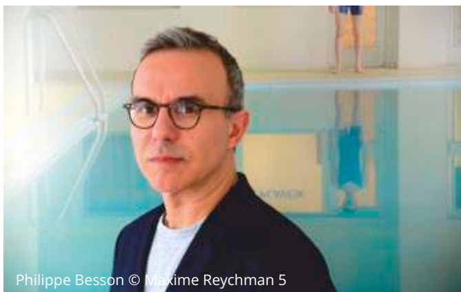
Philippe Besson 5

Jego powieści przetłumaczone są na 20 języków. Część dzieł doczekała się polskich wersji, m.in.: „Być przez chwilę sobą”, „Pod nieobecność mężczyźni”, „Babie lato”, „Niepewne dni”. Philippe Besson jest również dramaturgiem – jego pierwsza sztuka „Un tango en bord de mer” była grana ponad 200 razy w paryskim Théâtre du Petit Montparnasse. W rozmowie z Piotrem Kraśko na pewno padną też pytania o Pałac Elizejski i Emmanuela Macrona, gdyż sporo mówi się o znajomości Bessona z prezydentem Francji, którego postać została opisana w najnowszej książce autora, „Un personnage de roman”.