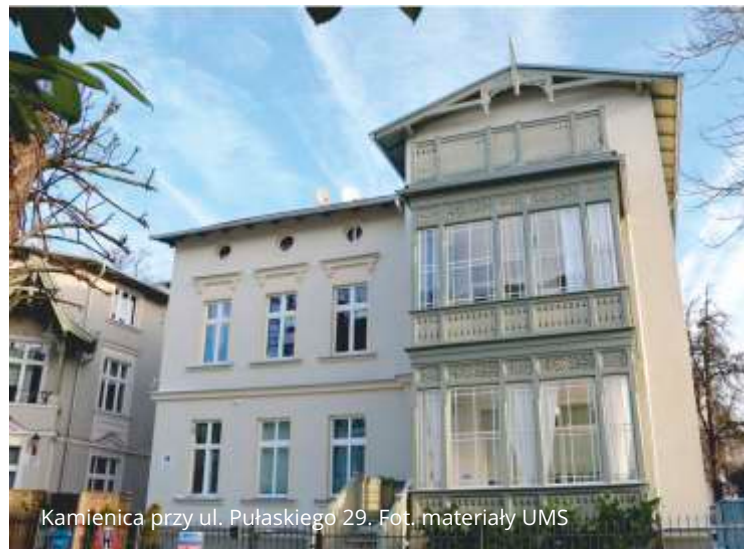
Kamienica przy ul. Pułaskiego 29.

Od 1998 r. Sopot wsparł finansowo remonty w ponad 400 zabytkowych budynkach. W 2024 r. dotacje na prace konserwatorskie, restauratorskie i roboty budowlane przy zabytkach otrzymają 34 wspólnoty mieszkaniowe i właściciele prywatnych budynków. Z budżetu gminy zostaną dofinansowane m.in. remonty elewacji trzech budynków, dwóch trzykondygnacyjnych werand, ośmiu par drzwi wejściowych, trzech kompletów okien witrażowych na klatkach schodowych, czterech dachów. Na dotacje zabezpieczono łącznie 1 440 422,16 zł.