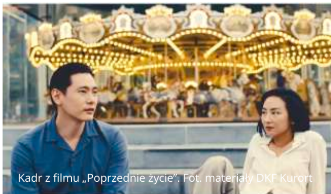
Kadr z filmu „Poprzednie życie”.