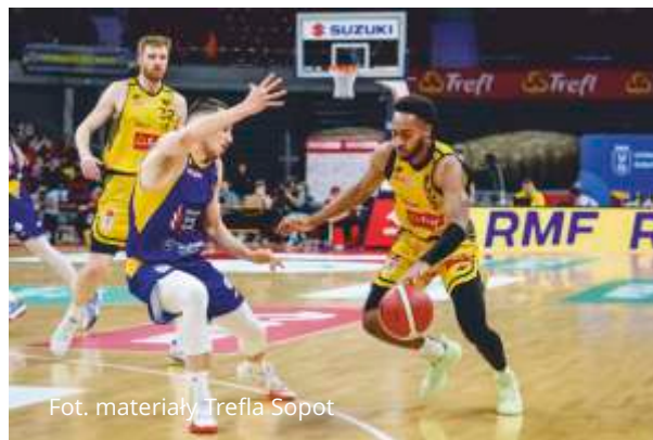
Fot. materiały Trefla Sopot

W przedostatniej kolejce sezonu zasadniczego ORLEN Basket Ligi koszykarze Trefla Sopot podejmą na własnym parkiecie WKS Śląsk Wrocław. Spotkanie odbędzie się w ERGO ARENIE 21 kwietnia, o godz. 17.30.