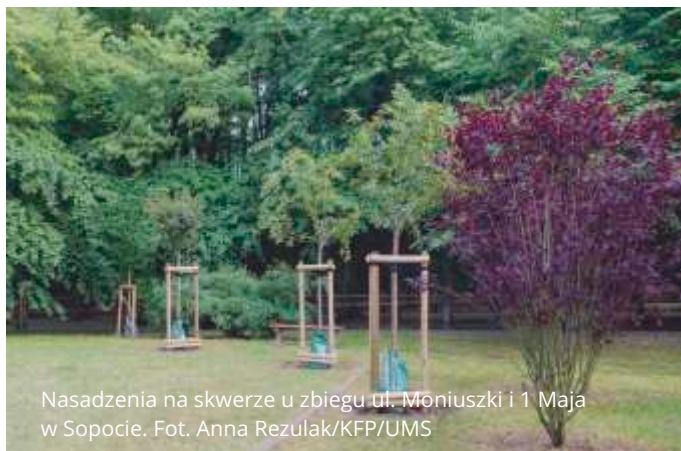
Nasadzenia na skwerze u zbiegu ul. Młotuski i 1 Maja w Sopocie.

Okolice stawu Reja, park Północny, skarpa Winickiego, ulice: Powstańców Warszawy, Malczewskiego, Żeromskiego czy Armii Krajowej – m.in w tych lokalizacjach w Sopocie sadzonych jest 65 drzew. Prace potrwać do 25 kwietnia.