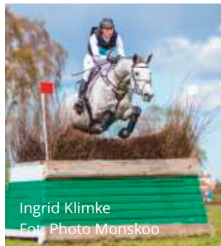
Ingrid Klimke

WKKW to jeździecki triathlon, na który składają się trzy dyscypliny rozgrywane w ciągu trzech dni. Na początek tzw. próba ujeżdżenia, która polega na wykonaniu odpowiednich figur na tzw. czworoboku, czyli specjalnie przygotowanym placu. Liczy się perfekcyjne opanowanie zwierzęcia oraz swoboda i elegancja wykonywanych figur.